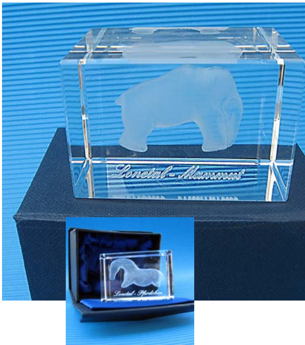
3D Glasmodell in repräsentativer Box

„Eiszeit“ - Kunst aus dem Lonetal Replikat aus Kunstharz von einer mehr als 35000 Jahre alten Tierplastik. Wohl die ältesten von Menschen- hand erschaffene Kunstwerke.