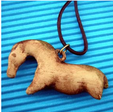
Als Anhänger mit Lederband