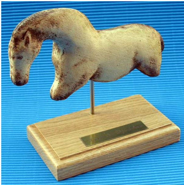
Modell mit Holzständer

Die Abbildungen sind Beispiele und können in verschiedenen Ausführungen geliefert werden