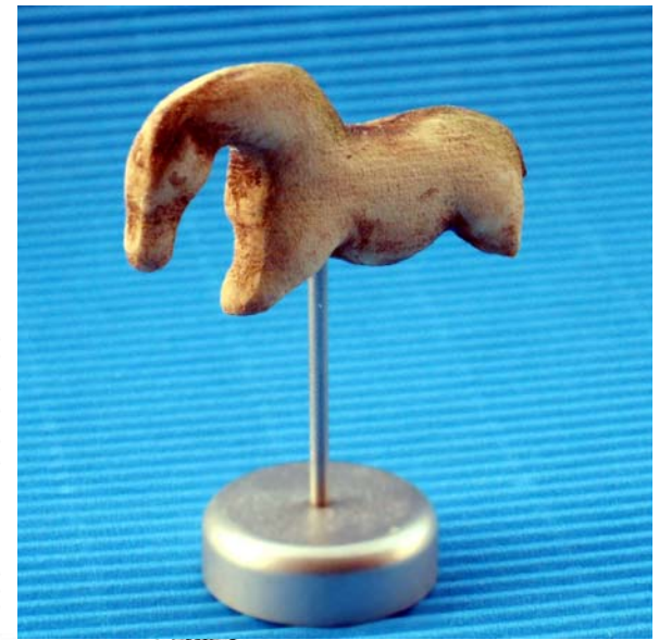
Modell mit Metallständer

Die im Original aus Elfenbein bestehende Kultobjekte werden im Lonetal hergestellt und jedes Objekt individuell handbemalt. Sie sind in verschiedenen Größen und Ausführungen erhältlich!